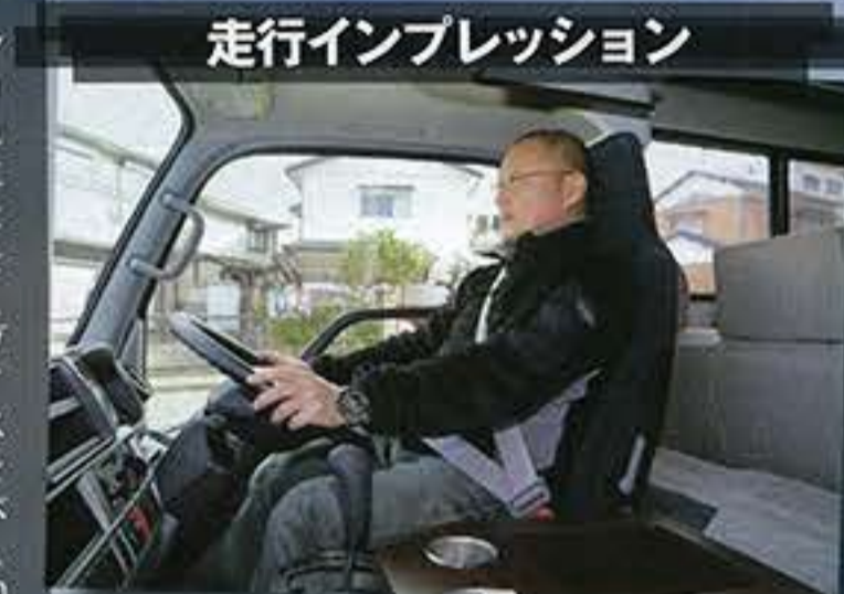
走行インプレッション

ヨコハマモーターセールのレガードは、カムロードのベースシャーシ自体に改良を加えて走行性能を向上させたモデル。リアオーバーハングの長さに合わせて延長したホイールベース、低重心化、バランスのとれた重量配分、バンクを廃した滑らかなボディデザインなどにより、走行性能をトータルでグレードアップしたエポックメイキングなキャブコンだ。 そんなレガードにオリジナルエアサスを組んだ「エアサスレガード」を販売しているのが、「カーセールス・ワタナベ」だ。同社はキャンピングカーの足回りに関して豊富なノウハウを持つ、キャンピングカー用エアサスのスペシャリスト。しかも、今回試乗したデモカーには、エアサスのみならず、同社オリジナルの減衰調整式ショックアブソーバー、強化トーションバー、強化フロントスタビライザーまでフル装備されている。