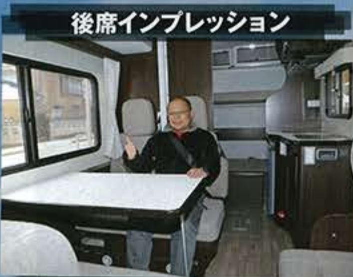
後席インプレッション

リアエアサス 強化トーションバー 強化ショックアブソーバー フロント強化スタビライザー