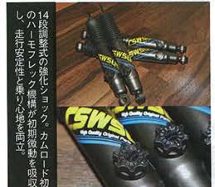
CSWオリジナル ショックアブソーバー